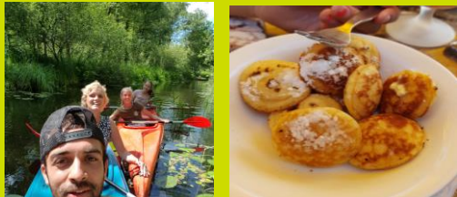
Kanovaren in de Weerribben en poffertjes eten.