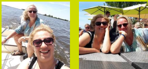
Lekker zeilen en een terrasje pakken.

Deze zomer zijn er weer diverse activiteiten ondernomen door de diverse buddykoppels. Een kleine indruk van de diverse foto's: