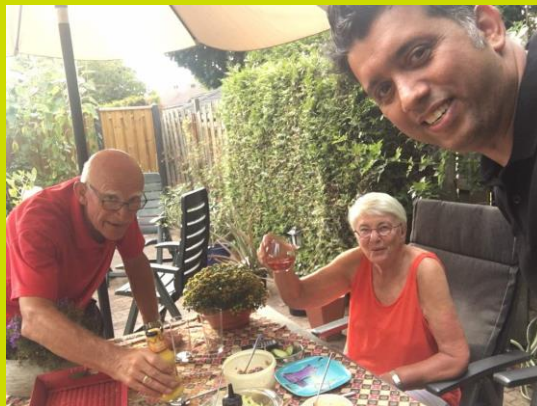
Of gezellig samen wat drinken in de tuin en aansluitend de maaltijd houden.

Maar ook werden gedurende deze zomerperiode ook de Nederlandse buddy's gemist vanwege hun vakantie. Kortom iedereen is weer blij dat ze de draad weer kunnen oppakken en nieuwe activiteiten kunnen plannen. Veel plezier allemaal.